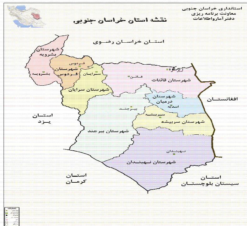
شکل ۵. نقشه استان خراسان جنوبی

در این مدل، جریمه کمبود کالا برای کالای ۱ و ۲ هر واحد ۱۰۰۰ تخمین زده شده است و ضرایب توابع هدف در روش معیار جامع برای سه تابع هدف اول ۰/۱ و برای تابع هدف چهارم ۰/۷ و همچنین مقدار I=1 در نظر گرفته می شود که بر اساس نظر خبرگان می باشد. همان گونه که در جدول (۱۱) دیده می شود در دوره اول سه شهر بیرجند، نهبندان و قاین به عنوان انبارهای موقت انتخاب می گردد، که این انتخاب با توجه به میزان تقاضا و هزینه جابه جایی بین مناطق مختلف یعنی مناطق آسیب دیده و مراکز تامین صورت گرفته است. در دوره بعد چون میزان تقاضاها تغییر می کند بنابراین، مدل تصمیم به ایجاد یک انبار موقت جدید در شهرستان فردوس می نماید. همچنین با بررسی جدول (۱۲) مشاهده می شود که در اکثر حالات، سعی شده است کل تقاضای هر منطقه آسیب دیده از طریق یک انبار موقت تامین گردد؛ زیرا این امر موجب کاهش هزینه های جابه جایی می گردد. با بررسی نتایج حاصل از مدل و داده های ورودی مساله مشاهده می شود استقرار انبارهای موقت بر اساس میزان فاصله از تامین کننده و همچنین فاصله انبار موقت با مناطق آسیب دیده صورت می پذیرد. همچنین بر اساس تابع هدف دوم مدل سعی می شود همه مناطق آسیب دیده تا حدودی با نسبت برابر کالا دریافت کنند تا رعایت انصاف در توزیع کالا صورت گرفته باشد.