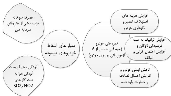
شکل ۱. معیارها و زیرمعیارهای اسقاط خودروهای سواری فرسوده

دیگرام طراحی شده در شکل ۱، نحوه دسته‌بندی معیارها و زیرمعیارهای اسقاط خودروی سواری را به تصویر می‌کشد.