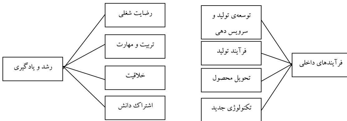
شکل ۱. ساختار سلسله مراتبی مناظر، شاخص ها و استراتژی های دستیابی به تولید کلاس جهانی