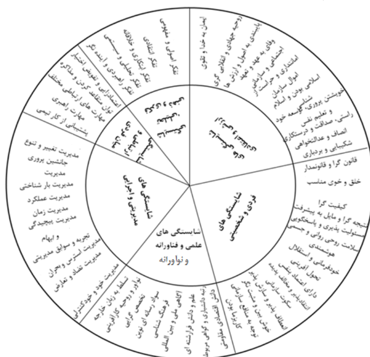
شکل ۲. الگوی شایستگی بهینه‌سازی شده مدیران دانشگاهی

گام نهایی در تحقیق حاضر پیشنهاد الگوی شایستگی برای گزینش مدیران دانشگاهی براساس سند دانشگاه اسلامی و متناسب با اصول عام و خاص دانشگاه اسلامی و اهداف آن طبق شکل ۲ می‌باشد.