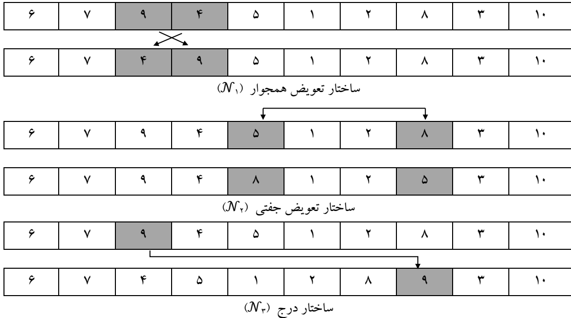
شکل ۴. ساختار همسایگی‌ها در الگوریتم جستجوی محلی

گام ۵: اگر l = 4 ، قرار دهید l = 1 و به مرحله ۲ بروید، در غیر این صورت به مرحله ۲ بروید.