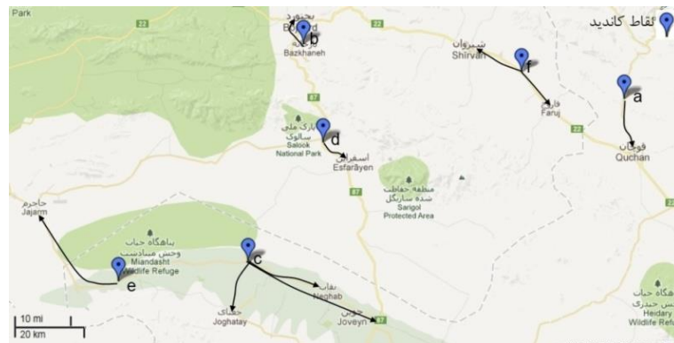
شکل ۱. نحوه تخصیص تسهیلات امداد به نقاط تقاضا ( پوشش ۱۰۰٪)