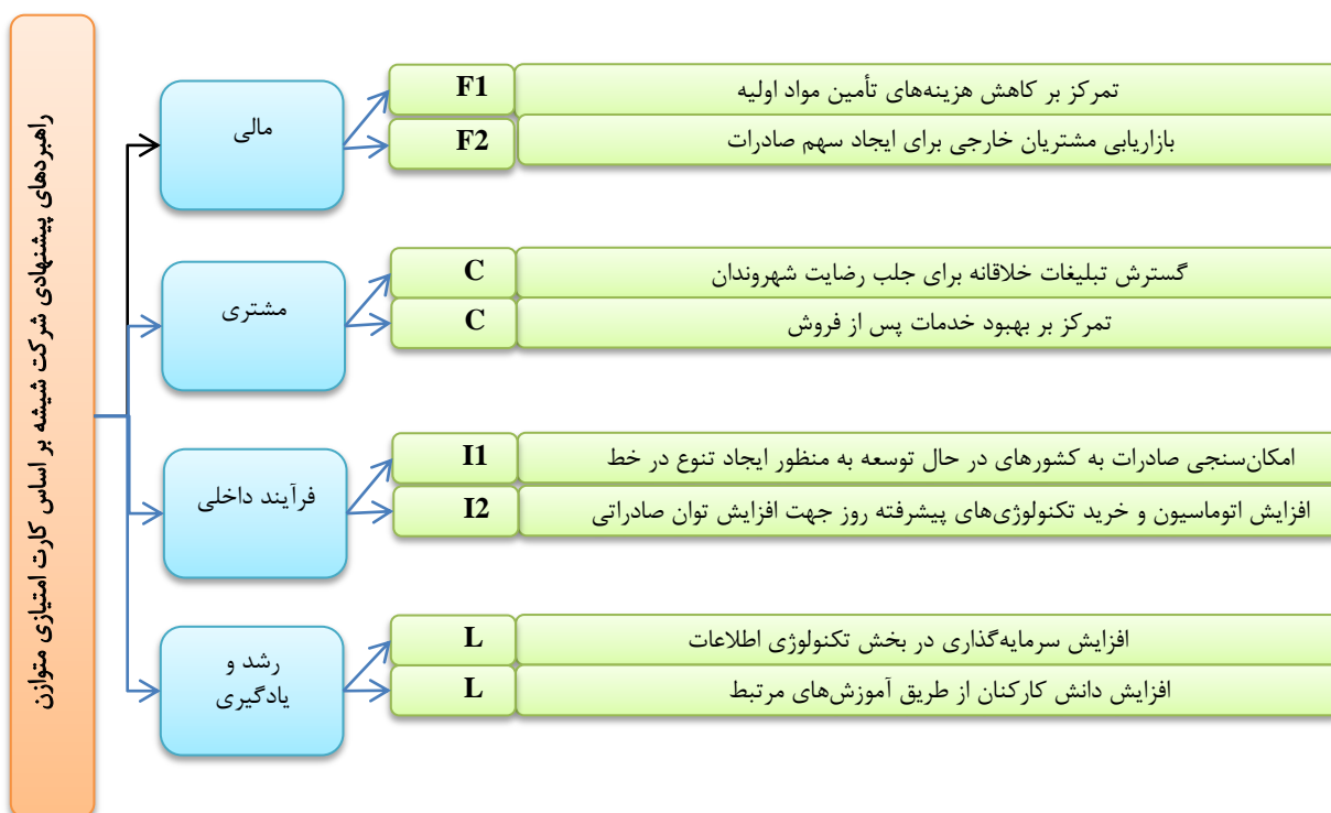
شکل ۲. راهنمادهای پیشنهادی شرکت شیشه بر اساس کارت امتیازی متوازن

سپس جدول ۱ در اختیار کارشناسان قرار گرفت و از آن‌ها خواسته شد در صورت تأثیرگذاری یک استراتژی از استراتژی دیگر، در خانه مربوطه، تأثیرگذاری را با علامت ستاره مشخص کنند که در نهایت جدول وابستگی بین استراتژی‌های وجوه مختلف ماتریس کارت امتیازی متوازن به صورت زیر درآمد: