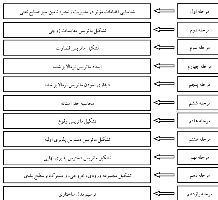
شکل ۱. مراحل ترسیم مدل (محقق ساخته)

طراحی مدل ساختاری اقدامات مدیریت زنجیره تأمین سبز با رعایت مراحل یازده گانه شکل (۱) انجام پذیرفت.